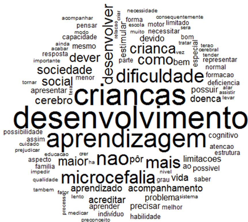
Figura 2 – Nuvem de palavras sobre concepções de desenvolvimento e aprendizagem de crianças com microcefalia para universitários

Considera-se que o olhar para uma criança, independentemente da existência de limitações ou não, deve ser ampliado para a capacidade própria de cada ser (VYGOTSKY, 1989). É indispensável olhar os avanços tidos e como esses avanços aconteceram não da forma esperada, mas aconteceram, e é este ponto a se evidenciar.